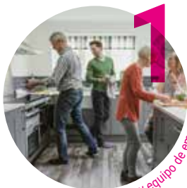
Línea blanca y equipo de empotrar