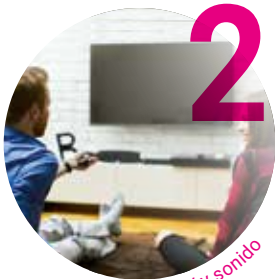
TV y sonido

Están cubiertos artículos elegibles de las secciones: